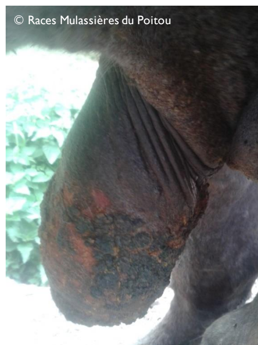
Figure 2 : Exanthème coïtal chez un étalon

Les mesures de prévention consistent en un examen minutieux des organes génitaux avant la saillie pour constater l'apparition des premiers symptômes et ainsi isoler le ou les équidés malades. Compte tenu du caractère hautement contagieux, la mise en place d'un circuit de soins, l'utilisation de matériel à usage unique et une hygiène irréprochable des actes de reproduction sont fortement recommandées.