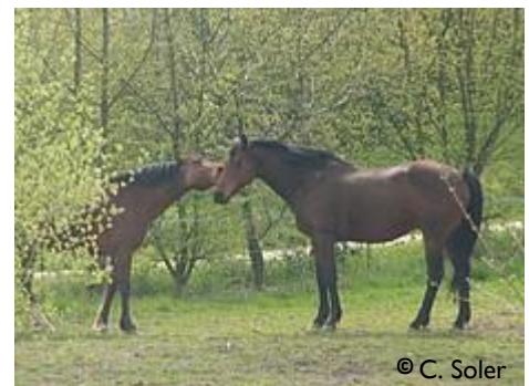
Figure 1 : Pas de transmission directe entre chevaux

transmettre directement d'un cheval contaminé à un autre sain.