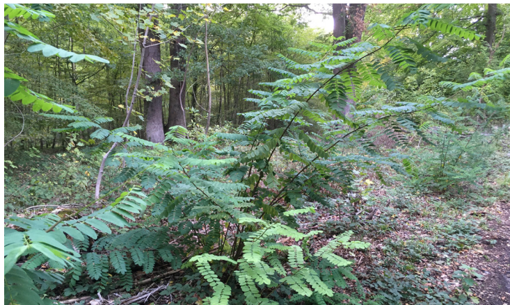
Sous-bois envahi de robiniers faux-acacia