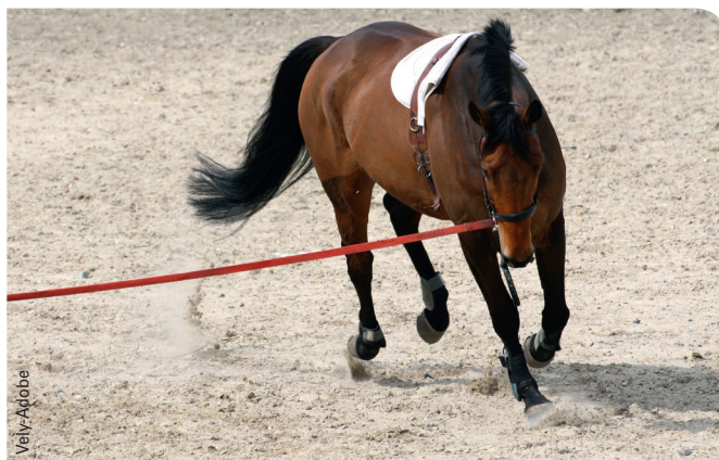
▲ Chez des chevaux adultes vaccinés très régulièrement (tous les 6 mois) contre la grippe, le rappel de vaccination peut être reporté de 4 à 8 semaines sans impact majeur sur la protection vaccinale.

« Les stocks de vaccins monovalents devraient être suffisants pour 2-3 mois. Le